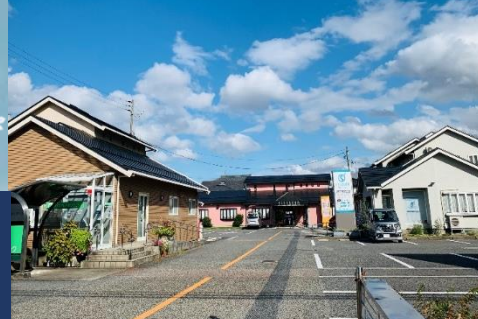
NMI調剤薬局 先輩薬剤師