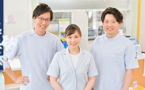
アルファグループ新潟Office