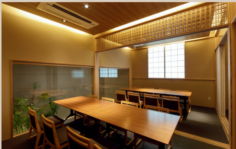
<基本レイアウト> テーブル4台、イス16脚 (最大テーブル6台、イス24脚)